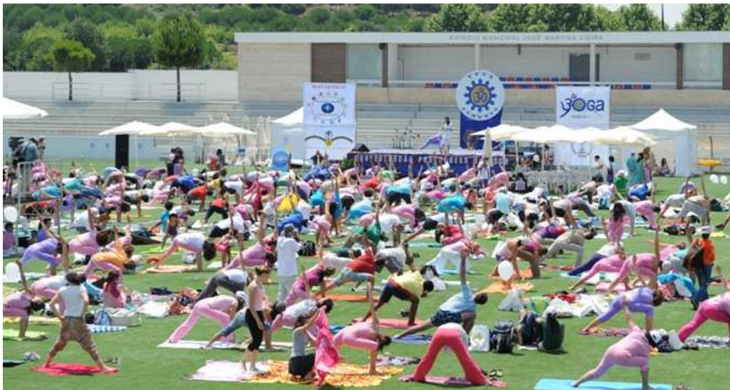
MEGA AULA DO YOGA – Purusha Namaskára

CELEBRAÇÃO DO DIA MUNDIAL DO YOGA DIA DA VIDA, DA HUMANIDADE E DA RIQUEZA DA DIVERSIDADE com o apoio da CÂMARA MUNICIPAL DE LISBOA e FUNDAÇÃO INATEL