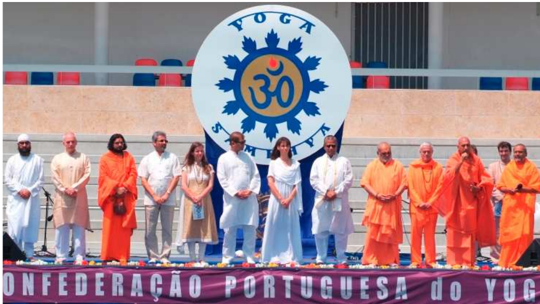
Os Svámin – Líders Hindus do Yoga Mundial

A Câmara Municipal de Lisboa é a anfitriã desta Grande Comemoração, constituindo-se como um parceiro estruturante deste Nobre Projecto, contribuindo com a Fundação INATEL para a sua valorização e divulgação. Também o Alto Comissariado para a Imigração e Diálogo Intercultural, Fundação Pró-Dignitate, Fundação da Juventude, Instituto Português da Juventude, Região de Turismo de Lisboa e toda a Comunidade Hindu de Portugal apoiam esta iniciativa potenciando assim a sua promoção e divulgação.