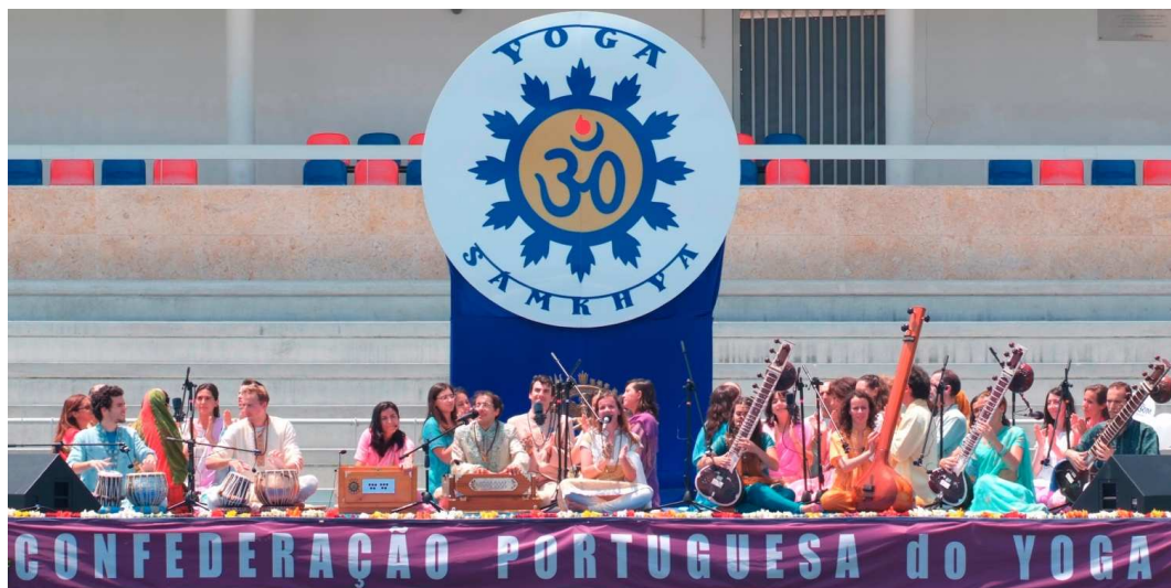
O OMKÁRA – Coral Orquestra da Confederação Portuguesa do Yoga

A Câmara Municipal de Lisboa é a anfitriã desta Grande Comemoração, constituindo-se como um parceiro estruturante deste Nobre Projecto, contribuindo com a Fundação INATEL para a sua valorização e divulgação. Também o Alto Comissariado para a Imigração e Diálogo Intercultural, Fundação Pró-Dignitate, Fundação da Juventude, Instituto Português da Juventude, Região de Turismo de Lisboa e toda a Comunidade Hindu de Portugal apoiam esta iniciativa potenciando assim a sua promoção e divulgação.