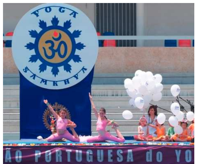
Em 2010 espalhados pelo estádio estiveram mais de mil praticantes. Adultos, Crianças e Seniors.